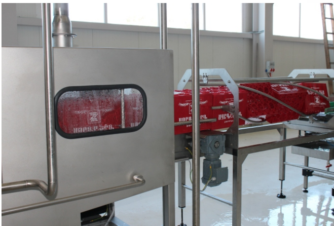
MP 2000 - obraceč přepravek