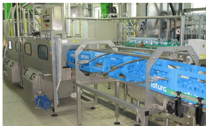
MP 2000 - PepsiCo CZ s.r.o., Teplice nad Metují Česká republika