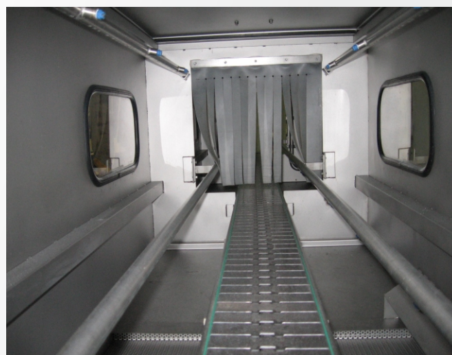
MP 2000 - vnitřní pohled