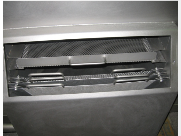
MP 2000 - filtrace mycího roztoku