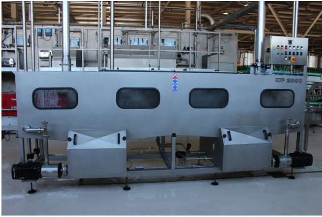
MP 2000 - mycí tunel